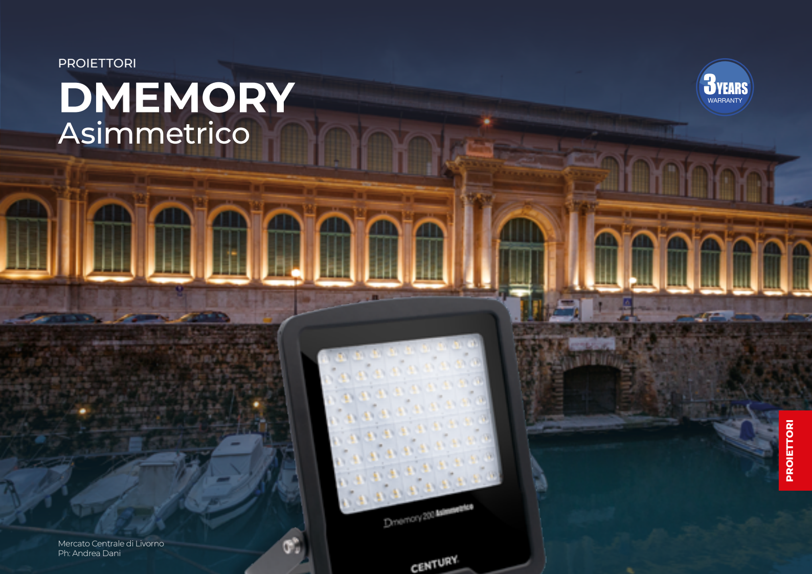
Mercato Centrale di Livorno